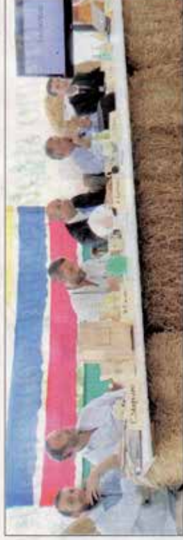
A Crispiano l'iniziativa promossa da «Greenroad» per approfondire i concetti di sostenibilità e competitività

stria di Taranto: «se improvvisamente dovessero venire a mancare 30mila posti di lavoro, si svilupperebbe una comunità di ranscore che si ripercuo-