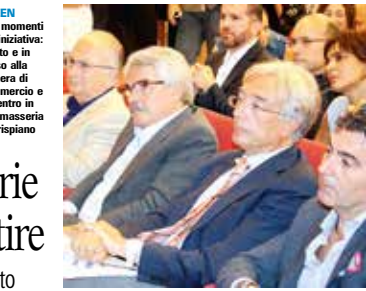
GREEN Due momenti dell'iniziativa: in alto e in basso alla Camera di Commercio e al centro in una masseria di Crispiano