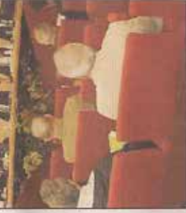
Un momento del convegno che si è svolto l'altro ieri alla Cittadella delle imprese, camera di commercio di Taranto

«A breve inizieremo a chiedere: dov'era la tua azienda quando è iniziata la rivoluzione? Dobbiamo renderci conto che siamo nella terza rivoluzione industriale, quella della green economy e noi abbiamo il dovere di farne parte. Cambia tutto: il modo di pensare, l'alimentazione, la sostenibilità, la cooperazione, le nuove tecnologie, i nuovi materiali, le nuove