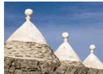
I tipici trulli incarnano l'essenza dei principi "green"