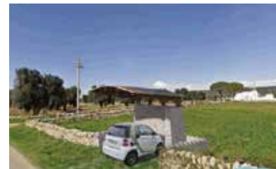
A sinistra una piazzola di ricarica per auto elettriche

I percorsi della Green Road tarantina saranno da assaporare in bicicletta, a piedi oppure a bordo di una automobile elettrica. Quello della vacanza eco compatibile, nella Puglia ionica, diventa un sogno possibile. Dalle masserie, custodi di tradizione su cui sono innestati germogli di moderno confort, fino al mare, blu e cristallino, il percorso già fruibile è lungo 17 chilometri, offre 200 posti letto nello charme di masserie e B&B. Sono attualmente disponibili risorse comunitarie, attivate attraverso specifici bandi per stimolare gli investimenti nel settore dell'artigianato tipico locale, del commercio di prodotti tipici e della loro distribuzione, dei servizi per l'infanzia e gli anziani. I bandi, inoltre, riguardano il restauro e la valorizzazione di beni immobili, nonché i servizi per l'economia e la popolazione rurale. I destinatari sono sia i privati che le istituzioni pubbliche, sempre nell'ottica della implementazione di un sistema Green, nel quale la Green Road rappresenta la nuova filosofia del fare turismo in cui sono determinanti le dinamiche di sviluppo sostenibili nelle sue svariate declinazioni. "Se i principi della new economy sono Green - conclude Prota - allora noi possiamo dire di essere nati Green, poiché i suoi elementi essenziali sono tutti all'interno delle nostre masserie". Per informazioni, visitare il sito: www.galcollinejoniche.it