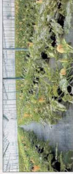
L'economia verde per uscire dalla crisi

«Ma noi siamo tra quelli che possono gettare solo il cuore oltre l'ostacolo». Prota cita ancora le parole del